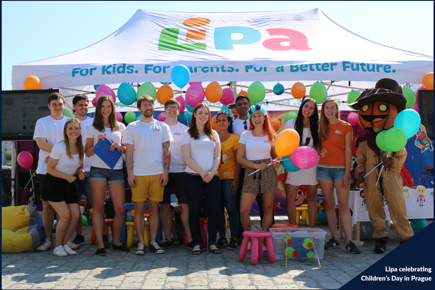
Lipa celebrating Children's Day in Prague