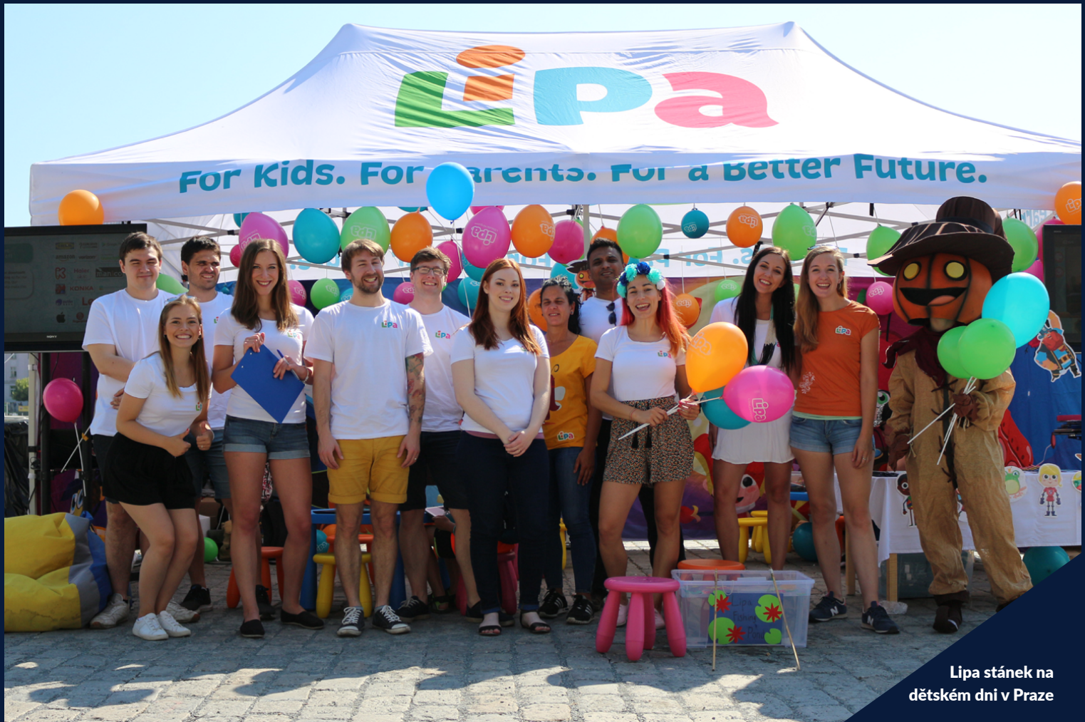
Lipa stánek na dětském dni v Praze