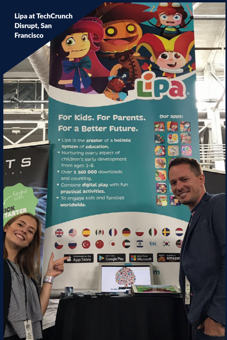
Lipa at TechCrunch Disrupt, San Francisco

For Kids. For Parents. For a Better Future.