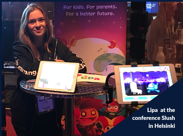
Lipa at the conference Slush in Helsinki