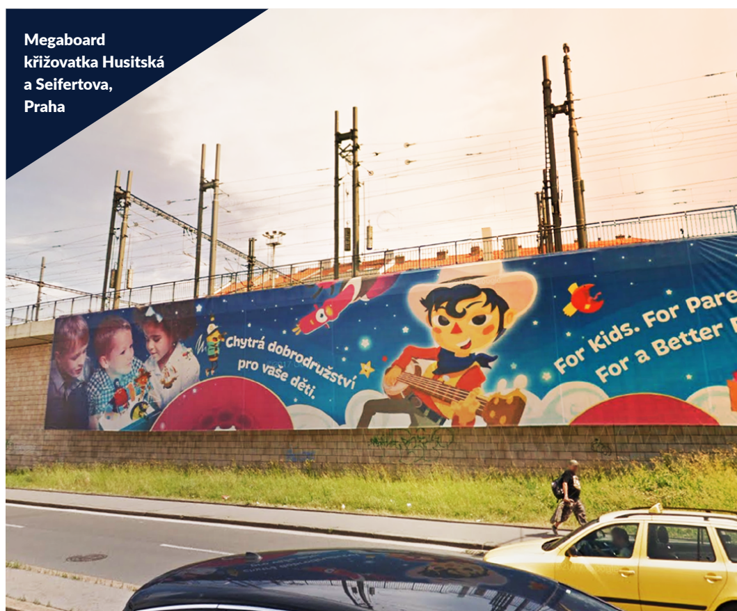
Megaboard křižovatka Husitská a Seifertova, Praha