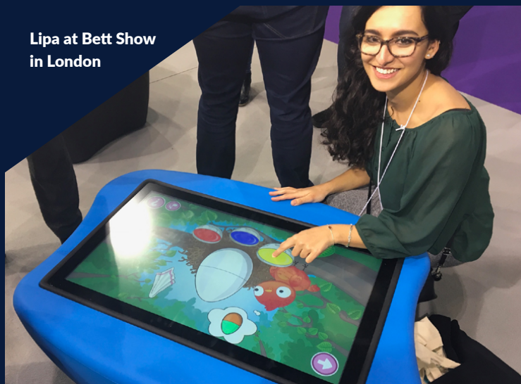
Lipa at Bett Show in London