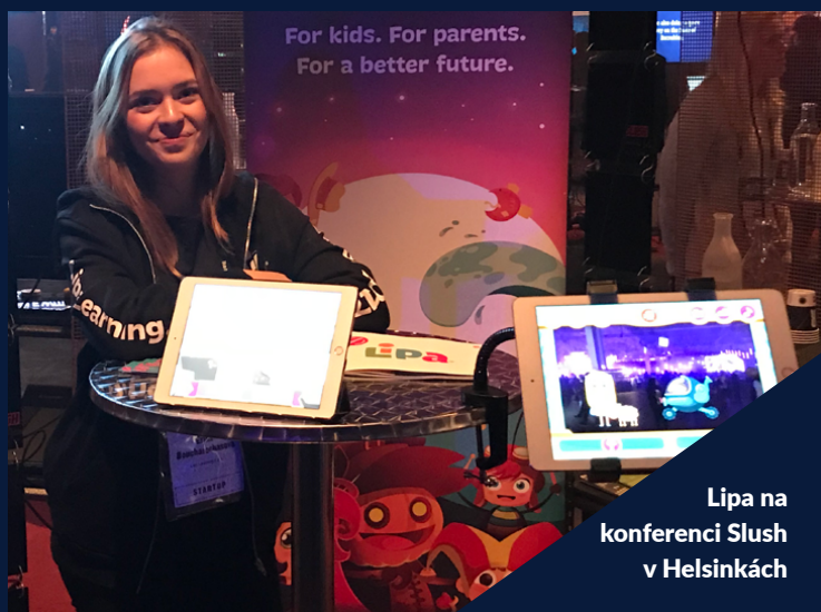
Lipa na konferenci Slush v Helsinkách