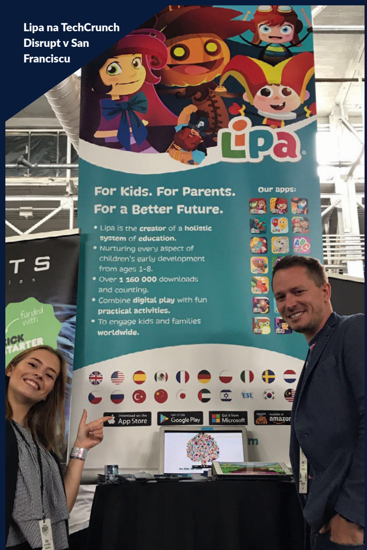
Lipa na TechCrunch Disrupt v San Franciscu

For Kids. For Parents. For a Better Future.