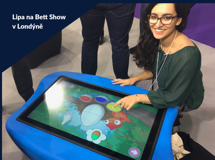
Lipa na Bett Show v Londýně