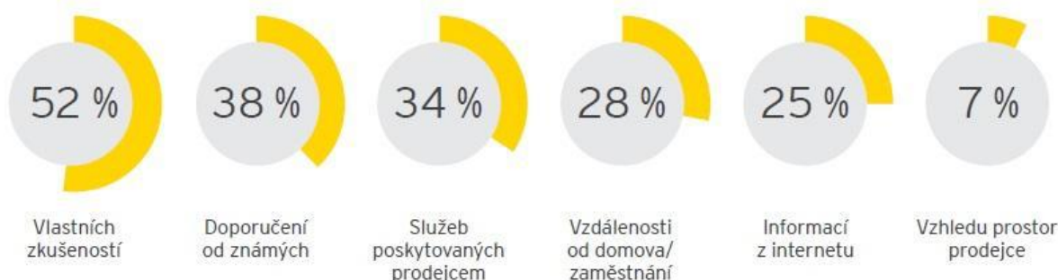
Obr. č. 2: Výběr obchodníka dle preferencí spotřebitelů.

Dle průzkumu z roku 2019 v příštích třech letech o změně auta uvažuje 35 % Čechů, desetina jej ale nechce vlastnit. Nejčastějším cílem pro nákup nového i ojetého vozu je stále klasická autorizovaná prodejna. Ojetý vůz by si čtvrtina respondentů pořídila od rodiny, známého nebo obchodního partnera. Trend nákupu vozidla přes internet stále roste. Zatímco v roce 2018 by si dokázalo takový způsob nákupu představit jen 29 % českých řidičů, v roce 2019 už to byla celá třetina. Respondentům by při nákupu online více než v roce 2018 chyběla možnost si vůz osobně prohlédnout (53 % vs. 46 % 30 ), naopak testovací jízda by jim chyběla výrazně méně (23 % vs. 34 %). Obchodníka, kterého by pro koupi vybrali, volí zejména dle předchozí zkušenosti. 31 Výběr obchodníka na základě preferencí spotřebitelů je znázorněn na obrázku č. 2.