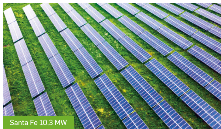
Santa Fe 10,3 MW