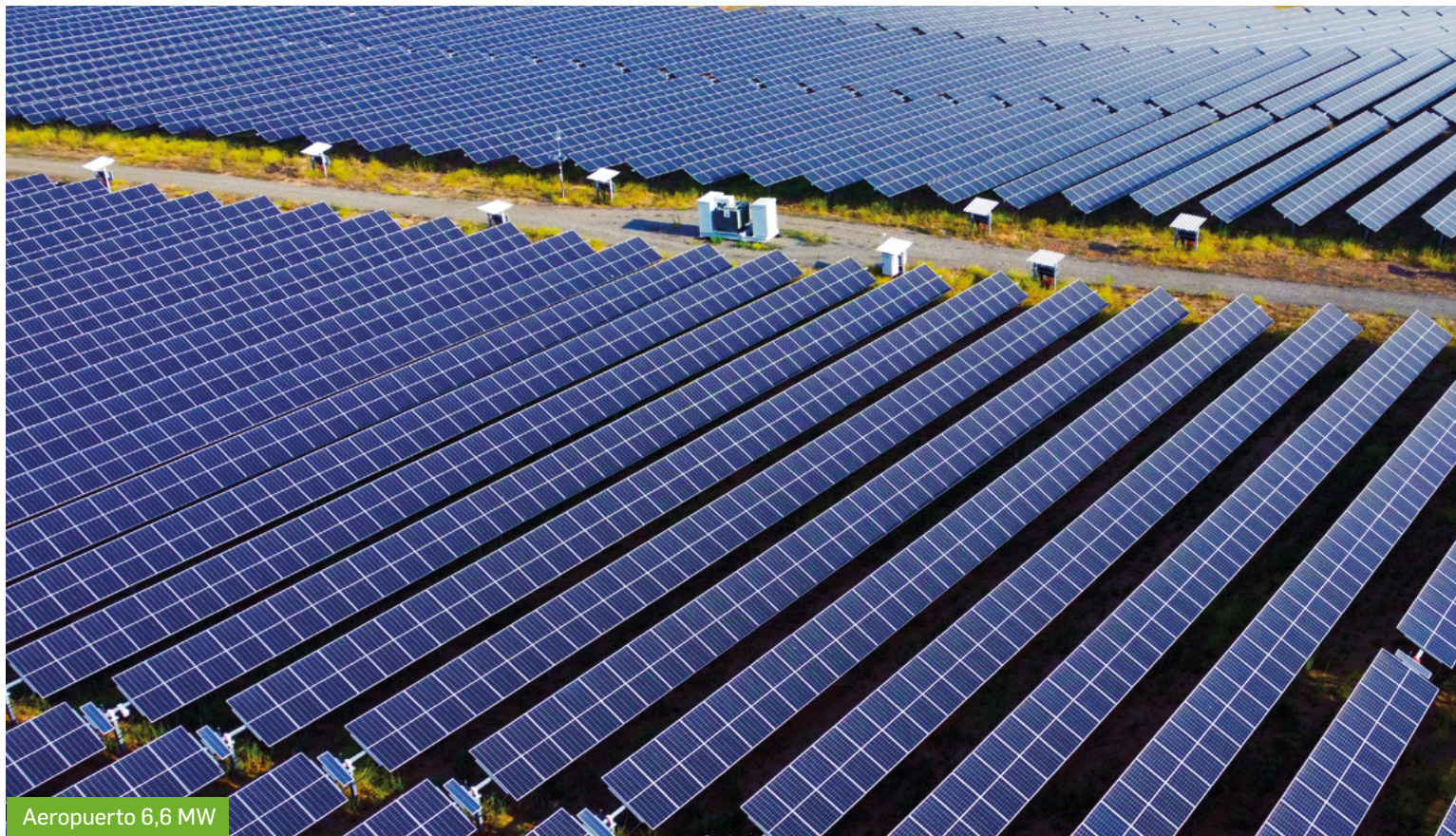
Aeropuerto 6,6 MW