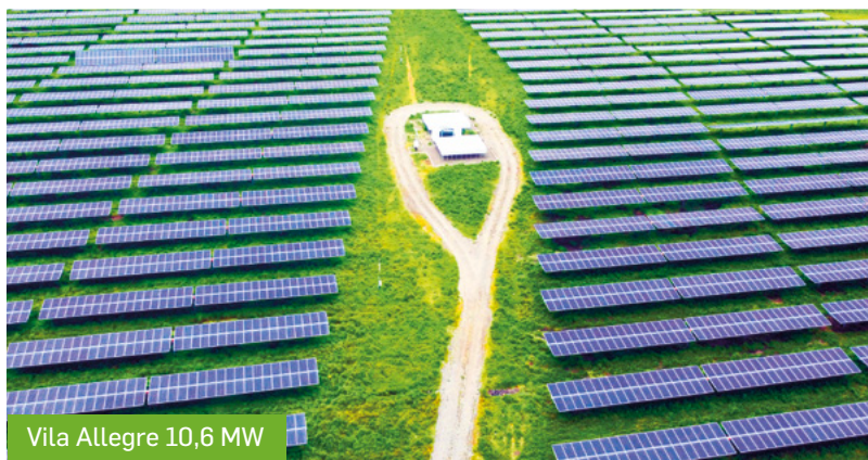
Vila Allegre 10,6 MW