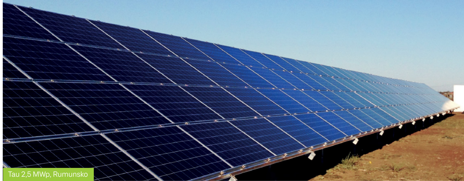
Tau 2,5 MWp, Rumunsko