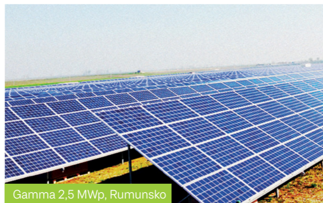
Gamma 2,5 MWp, Rumunsko