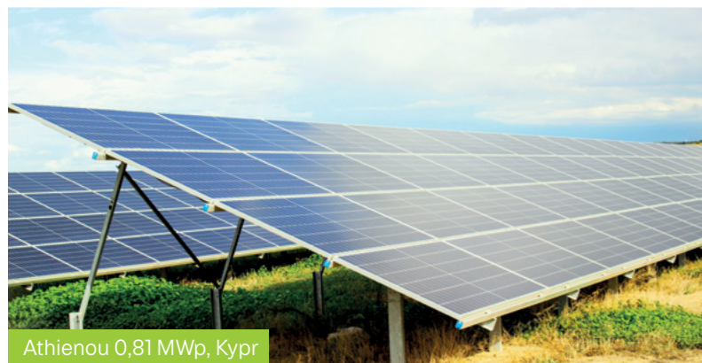
Athienou 0,81 MWp, Kypr