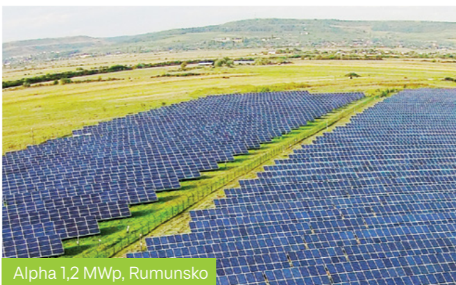
Alpha 1,2 MWp, Rumunsko