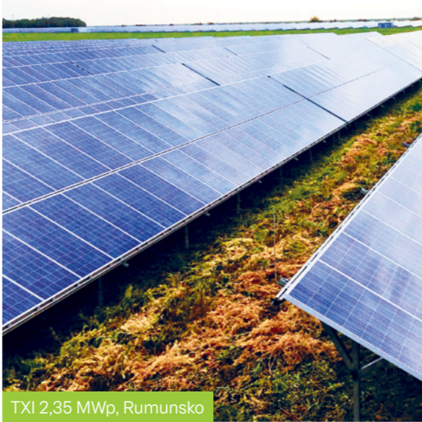
TXI 2,35 MWp, Rumunsko